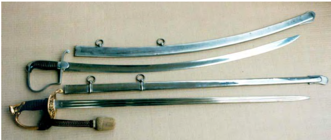
Das alte und neue Seitengewehr der sächsischen Feldwebel