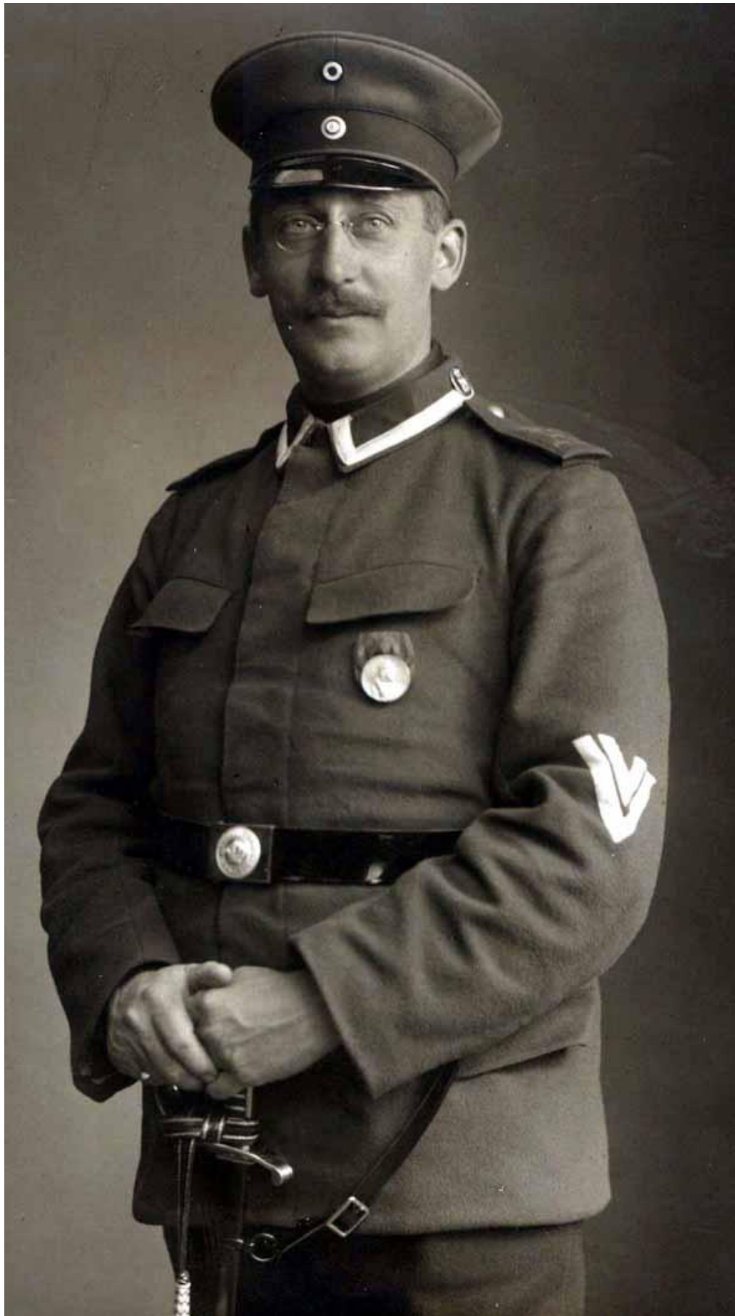
Vice-Feldwebel der 117er im November 1914