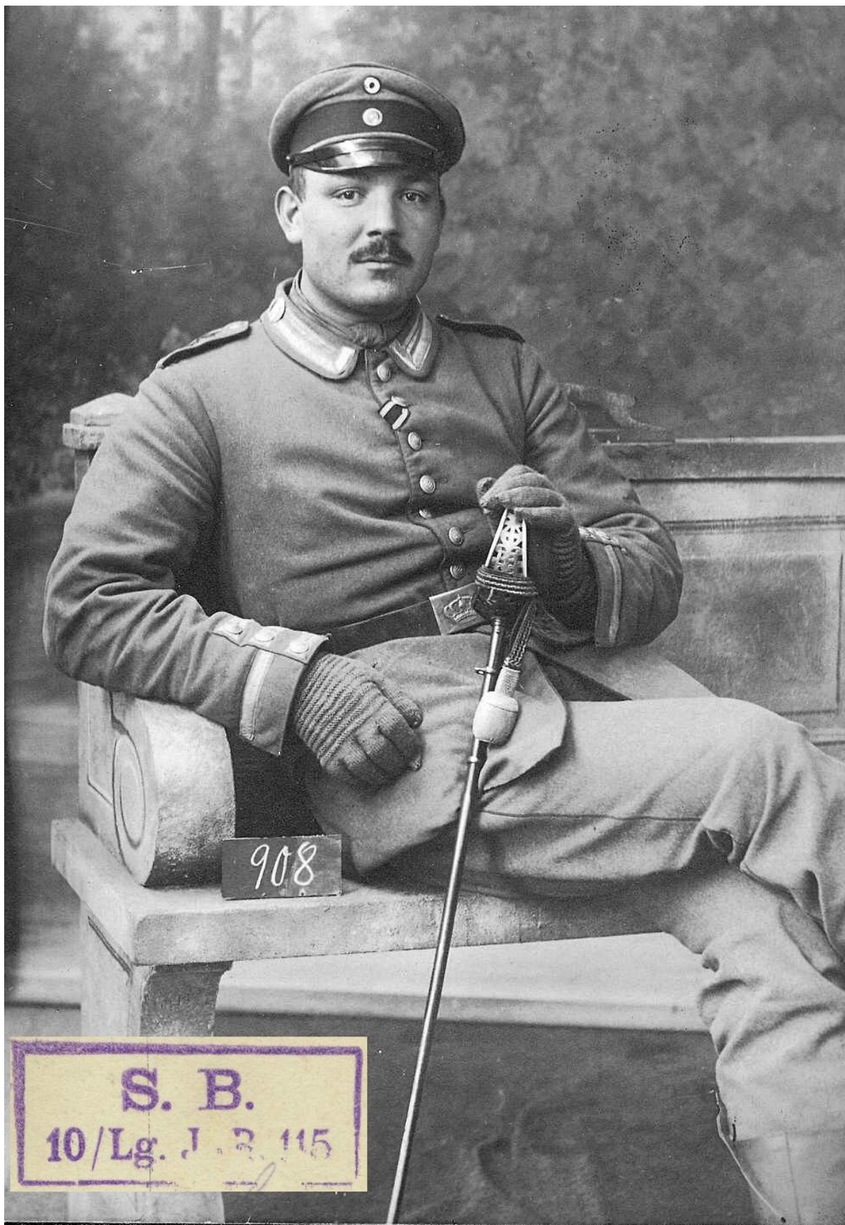
Vize-Feldwebel der Reserve aus der 10. Kompagnie des Leibgarde Infanterie-Regiment Nr. 115.