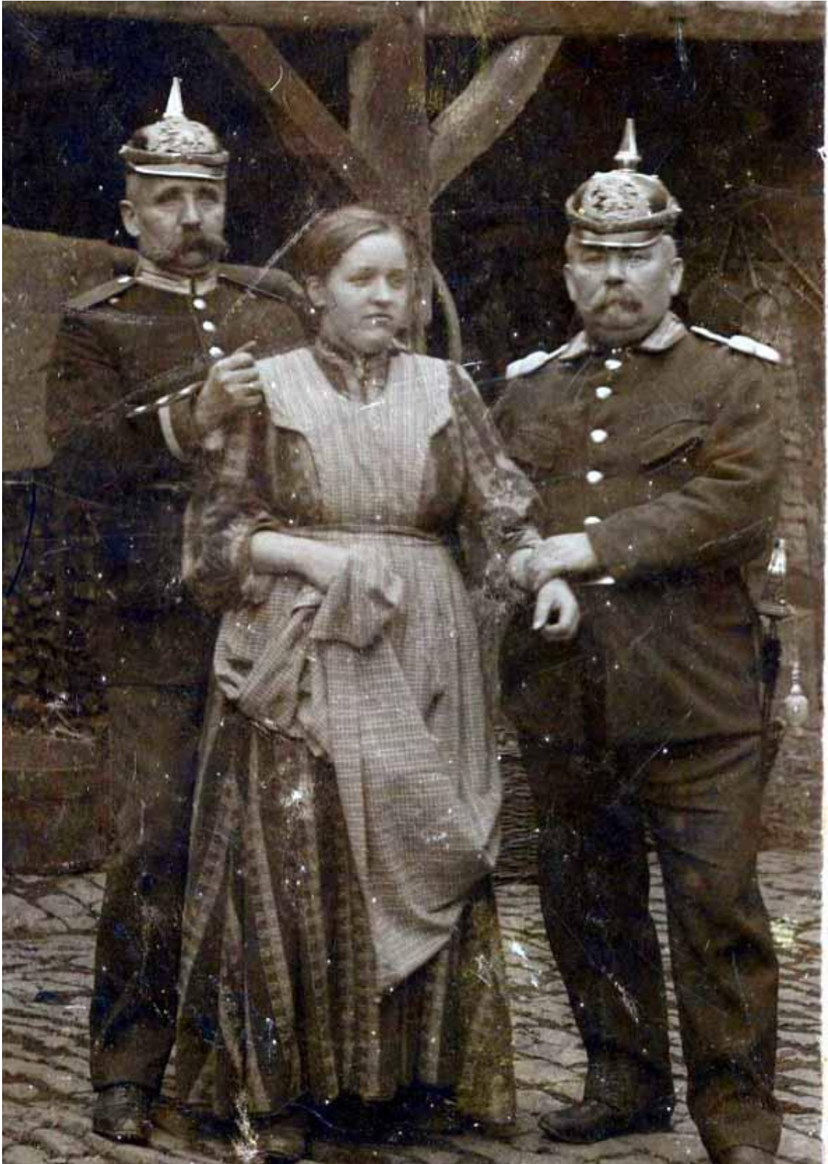
2 großherzoglich hessische Gendarmen auf einer gestellten Aufnahme (?) einer Verhaftung. Das "Weibsbild in Kittelschürze" ist allein für sich schon sehenswert, die beiden Beamten lassen eher den Verdacht auf "Bauerntheater" aufkommen. Nur, die uniformkundlichen Details stimmen. Nach den beiden unterschiedlichen Waffenröcken mit Schulterklappen und "Kleeblättern" dürfte die Aufnahme um 1890 entstanden sein.