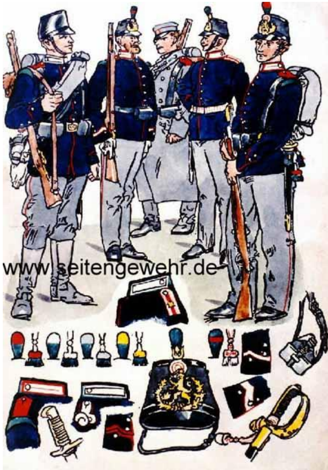
Skizze / Probearbeit von Paul Pietsch bzw. Herbert Knötel zu dem erwähnten Brauer-Bogen.