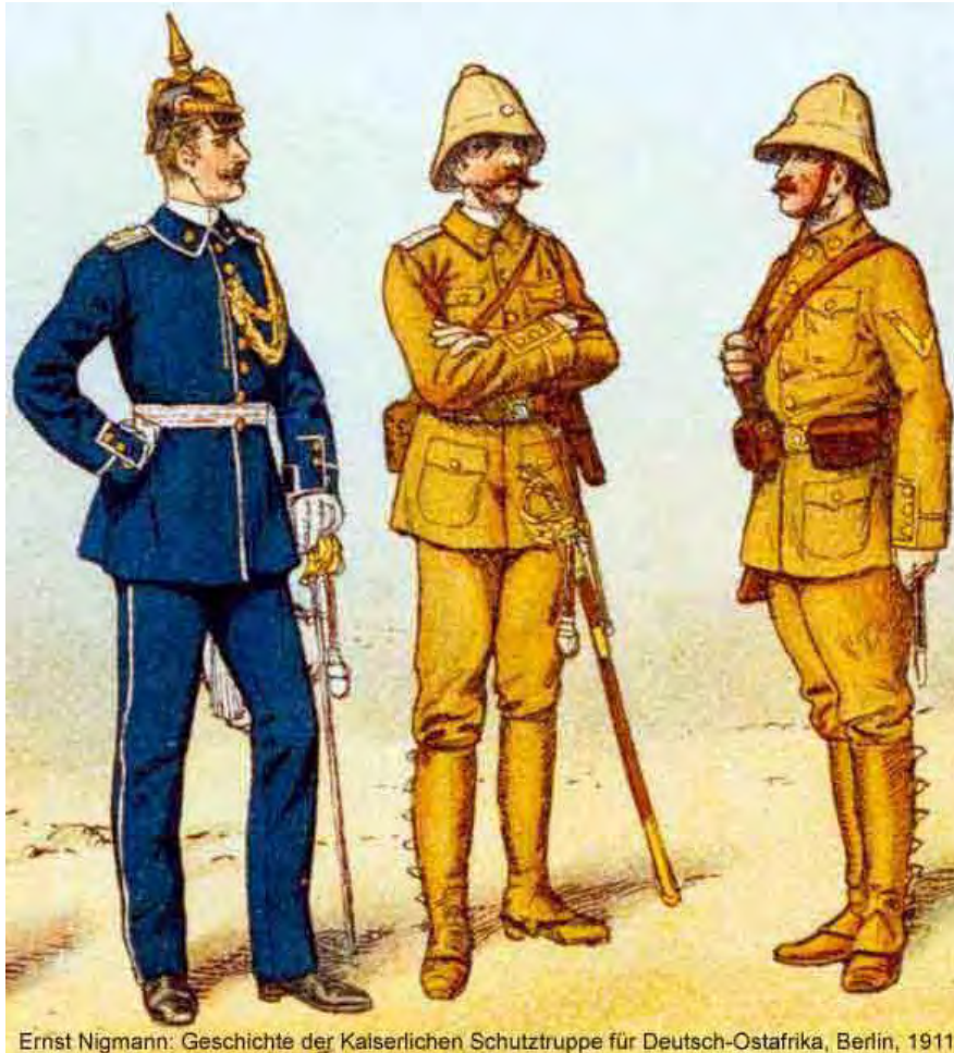
Ernst Nigmann: Geschichte der Kaiserlichen Schutztruppe für Deutsch-Ostafrika, Berlin, 1911.

Der Taillengurt und der runde geflochtene Trage- und Schleppriemen aus naturfarbenem Leder. Taillengurt 3,9 cm breit. Vergoldetes Schloß mit darauf befindlicher Kaiserkrone. Trage- und Schleppriemen sind durch Ringe am Taillengurt und durch vergoldete Karabinerhaken am Säbel befestigt. Kettchen zum Aufhaken des Säbels.