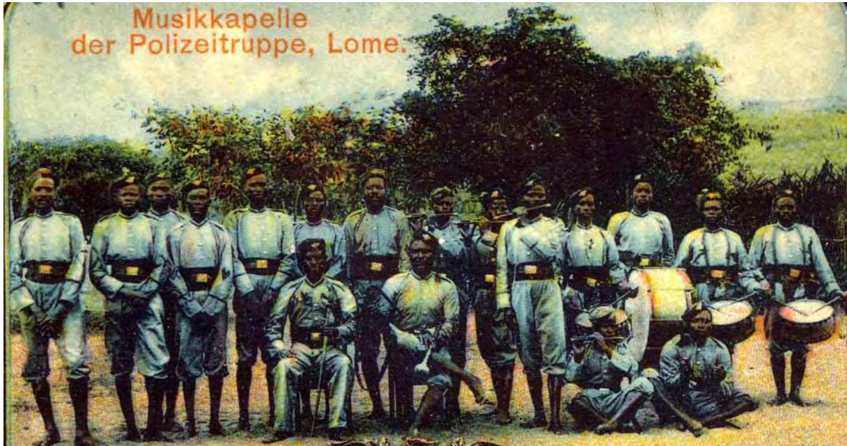
Die Musikkapelle der Polizeitruppe Togo um 1910 13

Gefreite und 140 bis 150 Polizeisoldaten 12 . Interessanterweise führt er einen Infanterie-Offizier-Degen neuen Modells. Wobei auf den Bildern schwer zu entscheiden ist, ob es sich dabei um das Modell der Portepeeunteroffiziere der Schutztruppe oder um das preussische Modell handelt. Bei Fotos der Paradeaufstellung wird er teilweise am rechten Flügel der Polizeisoldaten stehend mit präsentiertem Degen abgebildet.