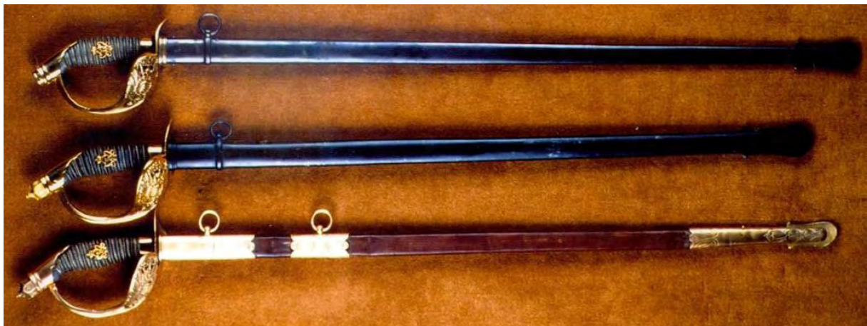
Die beiden Varianten des Offizierdegens und darüber die Waffe der Portepee-Unteroffiziere.

19. Säbel und Säbelkoppel (zum Feldanzug). Wie zu A.20, mit der zu G.18 erwähnten Abweichung bezüglich des Schlosses. Der Säbel jedoch mit der zu B.15 erwähnten Unterscheidung."