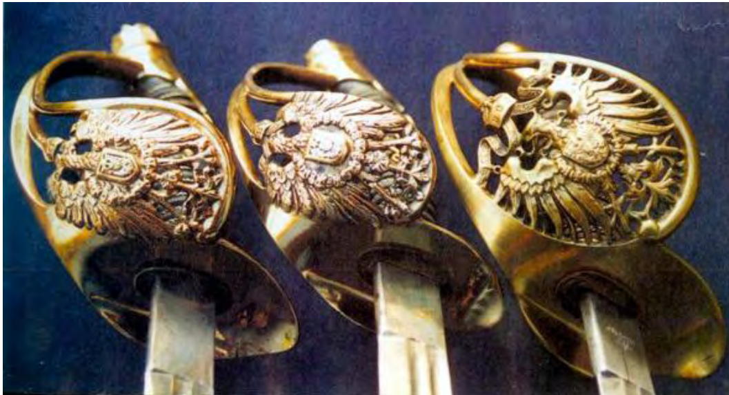
Schutztruppen-Offizier-Degen a/A für Offiziere und Portepee-Unteroffiziere sowie der Degen n/A (n.l.n.r.). Gut sichtbar die Befiederung und die Blickrichtung des Adlers.

Eine Anwendung von heutigen fachterminologischen Begriffen auf frühere Vorschriften ist nur mit Einschränkungen möglich. Der Unterschied zwischen Degen und Säbel wird im heutigen Sprachgebrauch sehr deutlich gezogen. Nur so ist es zu erklären, daß hier unter der Rubrik Säbel eindeutig ein Degen beschrieben wird. Auf eine eingehende Waffenbeschreibung der Schutztruppen-Offizierdegen a/A und n/A wird verzichtet. Die Modelle analog zum preußischen M/89 sind in der Literatur hinreichend beschrieben. Aussehen und Form des jeweils verschieden geformten Gefäßes, Adlers sowie dessen Blickrichtung gehen zusätzlich aus den Abbildungen hervor. Der in Sammlerkreisen vertretene These: „a/A Blickrichtung des Adlers nach links und die Federn bis zum Bügelrand, n/A Blickrichtung nach rechts und das Gefieder nur bis vor die Bügelverstärkung“ kann wie aus der Abbildung ersichtlich nur in Bezug auf die Blickrichtung zugestimmt werden. Spätestens bei der 1913 beginnenden Aptierung verlieren auch diese Merkmale zumindest bei privat erworbenen Waffen ihre Gültigkeit.