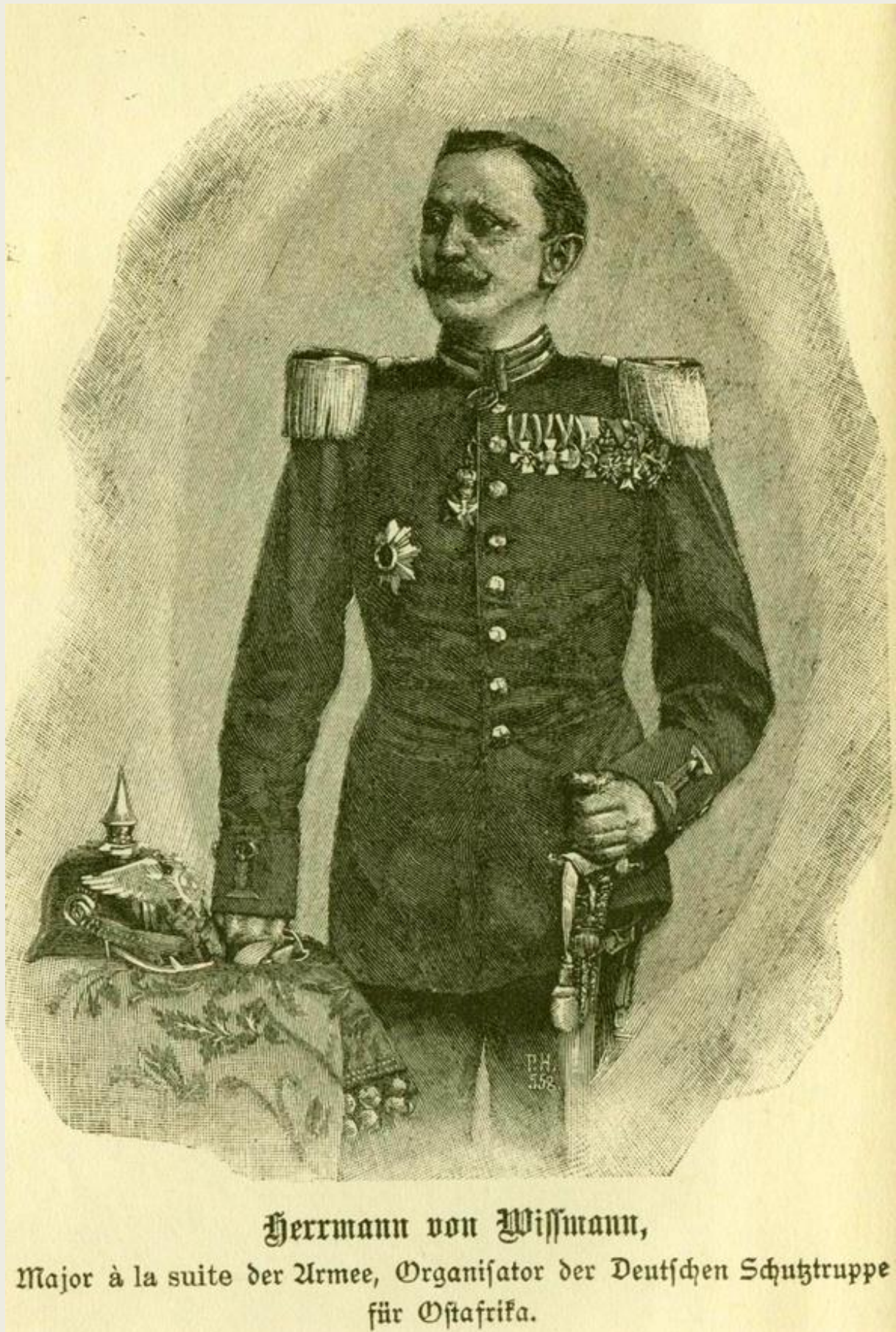
Herrmann von Wissmann, Major à la suite der Armee, Organisator der Deutschen Schutztruppe für Ostafrika.

Hermann von Wissmann mit einem „Mameluckensäbel“ [Kilij / kilidsch] 40 .