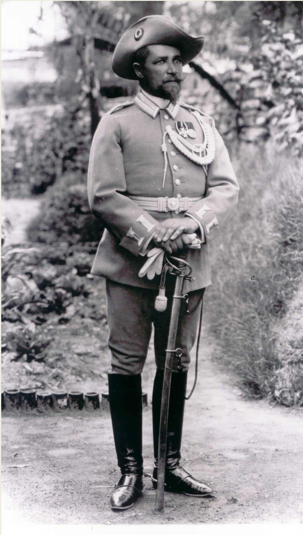
Hauptmann der Schutztruppe DSW mit dem Säbel für berittene Infanterie-Offiziere. 39