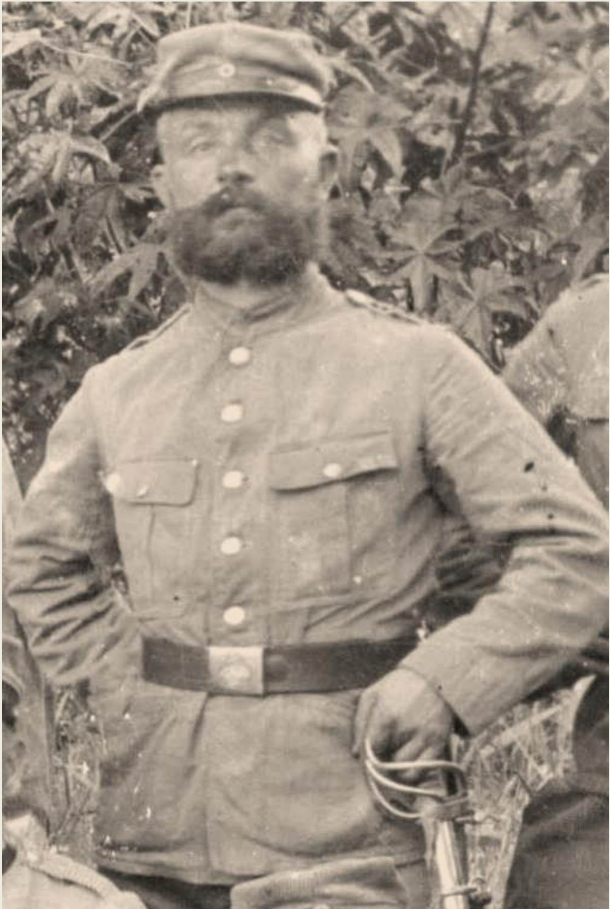
Unteroffizier der Schutztruppe DSW mit dem Säbel, 1883. 38