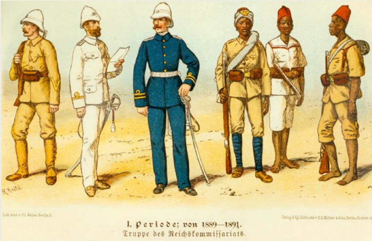
Kaiserliche Schutztruppe für Deutsch-Ostafrika 30